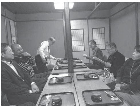
十二月四日（木）の「読書会」は、特に課題図書を設けずに、今年一年間で印象に残った本・映画・展示・音楽等々について参加者同士で発表し合いましたが、さすがは溢れるような教養（？）をお持ちの方々ばかり。物理学・環境問題・歴史・イン・能登の活性化・某美術館評等々から話ほとんど拡大し、風俗の話題（社会学・経済学的に分析、とてもマジメでシリアス）やウルトラマンにまで及びました。やがて、読書会から忘年会に移行し、料理・お酒・器へと話題が移りました。当日は、みぞれ混じりの天候でしたが、とてもホットな議論が飛び交った読書会&忘年会となりました。【寄稿：西野経営教養委員長】

国際ビジネス研究会は十二名でベトナム・ダナン市を視察した。小松発、韓国ソウル・インチョン空港経由ダナン着で、トランジットは四時間三〇分待ちでダナンには午後一〇時頃到着した。二日目はホイアン市内観光、街全体が世界遺産で情緒があり観光客で凄い賑わいだ。夜はランタン祭の日でトウボン川両岸は綺麗なランタンが飾られ、灯籠流しみたいな光景を見た。三日目はミーン遺跡観光とゴルフ組に分かれた。四日目はフエ市方面へ向いグエン朝王宮、カイディアレ帝廟（世界遺産）等を観光した。