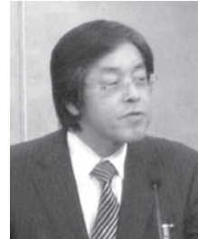
一月二十 九日(木) 金沢東急ホ テルにて役 員選出総会 (臨時総 会)