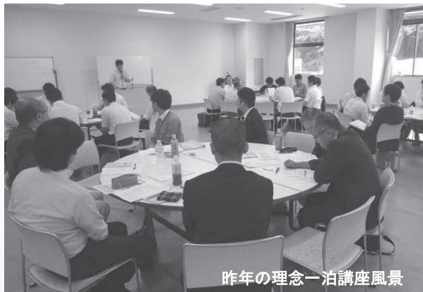
昨年の理念一泊講座風景

「何のために経営をしているのか？」と問われて、即座に、しかも明確に答えられる人が何人いるだろうか。日頃、考えてみたこともないところに突然小石を投げられ、経営者としてふさわしいのかを試されているような質問だ。