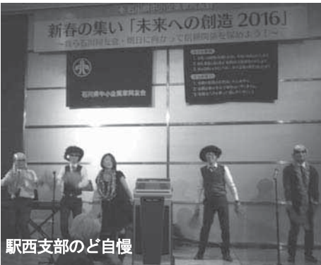
駅西支部のど自慢