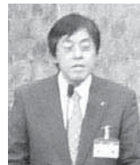
一月二十八日 (木) 金沢東急ホテルにて役員選出総会(臨時総会)

が開催され、二〇一六年度の理事十九名・監事二名と委員長・部会長八名が承認された。新たに少数の会員支部からの意見も幅広く反映しようとして能登支部、南加賀支部から理事が選任された。