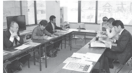
8人の部門メンバーが出席し、A4リーフレットの表紙案について検討した

広報部門では現在までのところ、青全交開催前に配布する広報物や当日使用されるガイドブック、ランチ&ナイトマップなどの編集制作を主な業務としている。5月12日の広報部門会議では、A4・6ページリーフレットの表紙案が示され、参加メンバーがデザインや文字内容をチェックした。