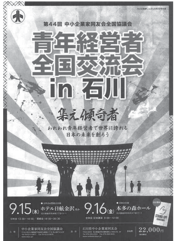
「中小企業家しんぶん」の付録として6月末に全国の会員に送られる

いわゆるネタバレになるので詳細は省くが、年少期に保有トラックが1台だけだった家業の運送業を、現在はグループで約2,100人を擁する物流企業へと自社を発展させてきた苦楽を伴うプロセスを赤裸々に明かす予定だ。対外的に訴求力のある講演タイトルの付け方についても様々な意見が交わされ、大筋だが「どん底から100億円企業への軌跡」（仮題）で固まった。今後、各種広報物にも反映されていく。