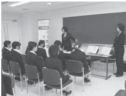
五月十一日(水) 十二日(木)の両日、大原学園金沢校にて合同企業