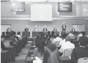
参加会員が青全交開催に向けてベクトルを合わせました