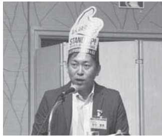
宗守重泰全体会部門長