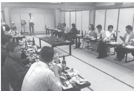
副支部長 グループ担当 (寄稿: 櫻井)

能登島の新鮮な魚介を使ったおもてなしを展開する能登島シーサイドハウスにて、ディナーを楽しみながらお互いの交流を深めるグループ会を開催しました。冒頭に河尻支部長から「本年度行われる青全交に向けて石川同友会が動いている。支部長就任以来、同友会の価値を深く感じるようになった。皆さんも積極的に参加してほしい」と開式のあいさつがありました。 能登島の獲れたて魚介でおなかを満たしながら、参加者各人が現在積極的に取り組んでいるマイブームを踏まえ、それぞれ二分の自己紹介を行いました。ゴルフというキーワードが多く上がったことから、早速六月中に能登支部コンペを企画する場面もありました。 会員は自身の参加率を上げよう、当日のゲストは同友会に入会しようという支部長の想いを後押しする機運が高まり、全員で交流を深める中、大盛会のうちに終了した合同グループ会でした。