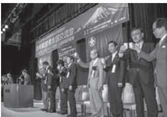
写真は昨年(山梨)の青全交の様子

青全交石川への参加申込みの締め切りは今月末です。会報誌7月号・8月号に同封した青全交リーフレット裏面に参加申込欄がありますので、分科会や全体会に興味を持たれた方は、必要事項を記入の上、事務局までFAXを。