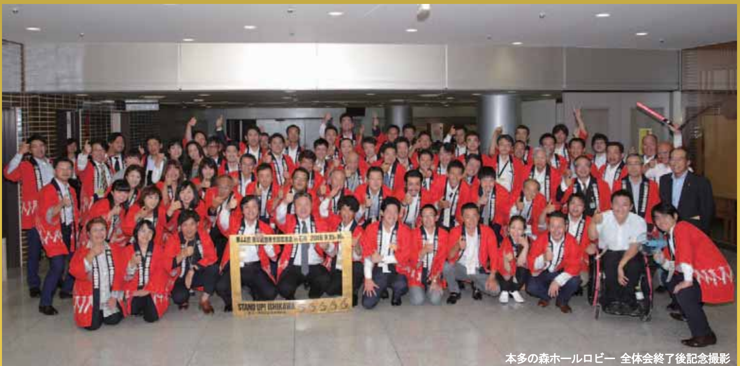
本多の森ホールロビー 全体会終了後記念撮影