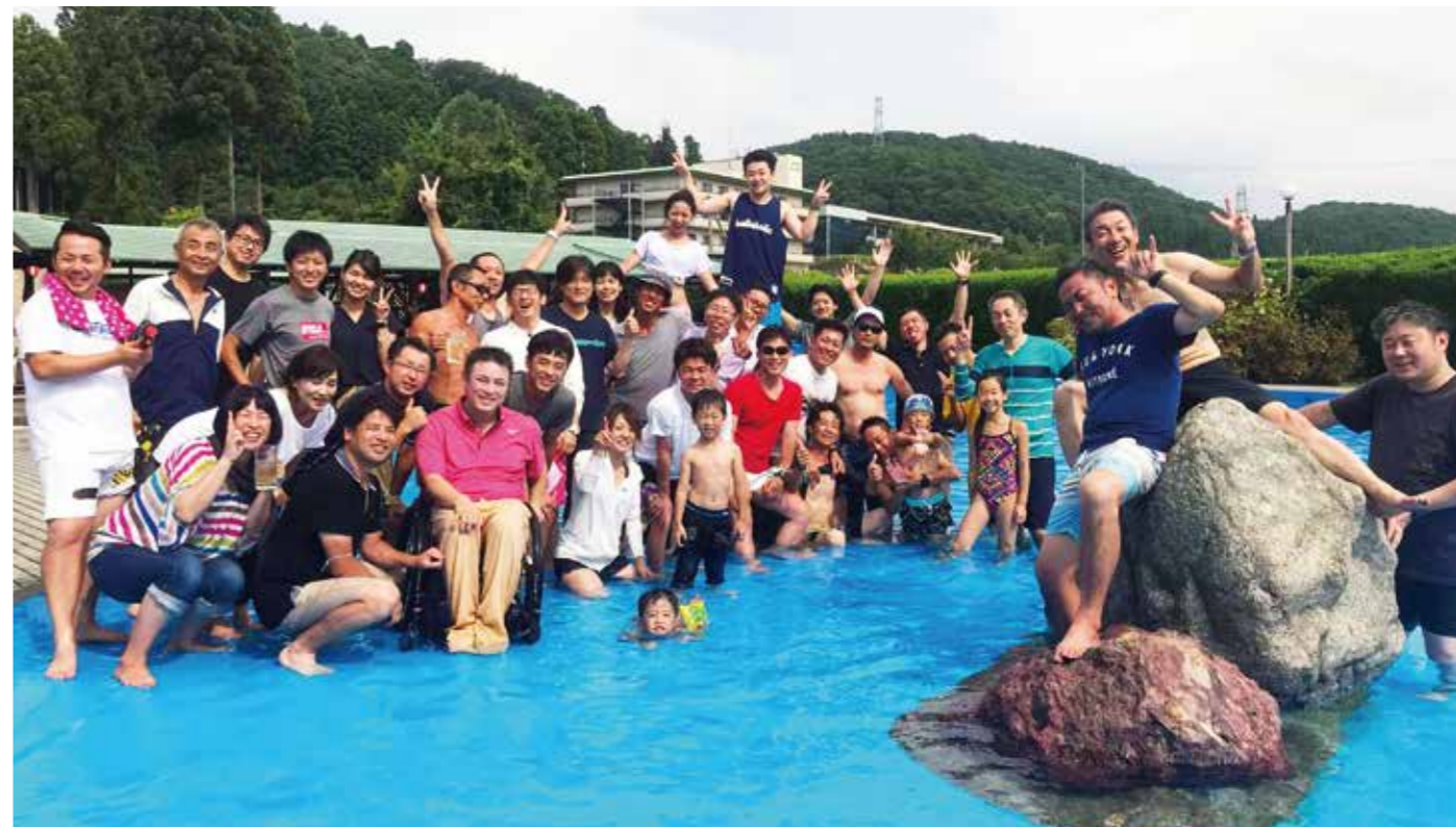
同友会合同グループ会で交流