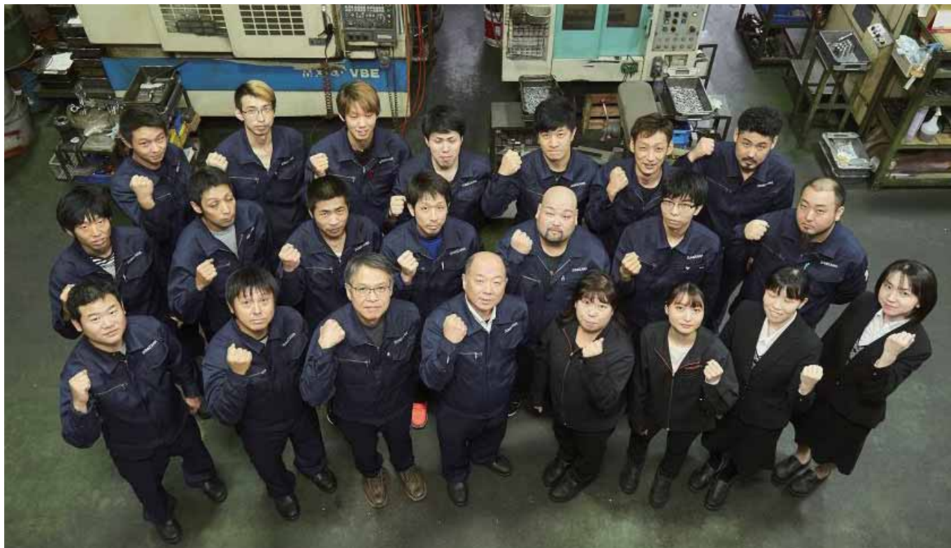
チャレンジ精神あるれる社員と共に