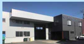
2018年2月に立ち上げた、第二工場 (示野工場)