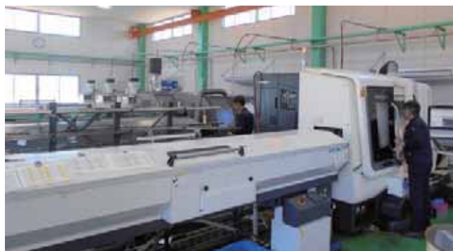
自動化に特化した第二工場の設備

高品質を実現し、材料調達から、機械加工、熱処理、表面処理までの一貫対応をしています。一方で自動化に特化した第二工場（示野工場）を2018年2月に設け、大幅な生産能力の増強、コストダウンをも実現し、多種多様な分野の取引が安定経営の基盤になっています。