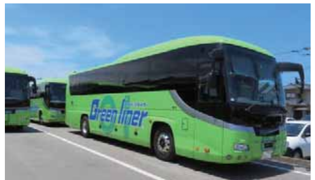
高速バス「グリーンライナー」

を図り、近代化・合理化を進めてきました。また、どこよりも早くインバウンド事業に参入することや、地元石川と東京ディズニーリゾートを結ぶ高速乗合バス事業などの新しいサービスを提供することにも力を注いでいます。中でも最新の衝突回避支援機能システムを、保有する全てのバスに搭載すると共にドライバー