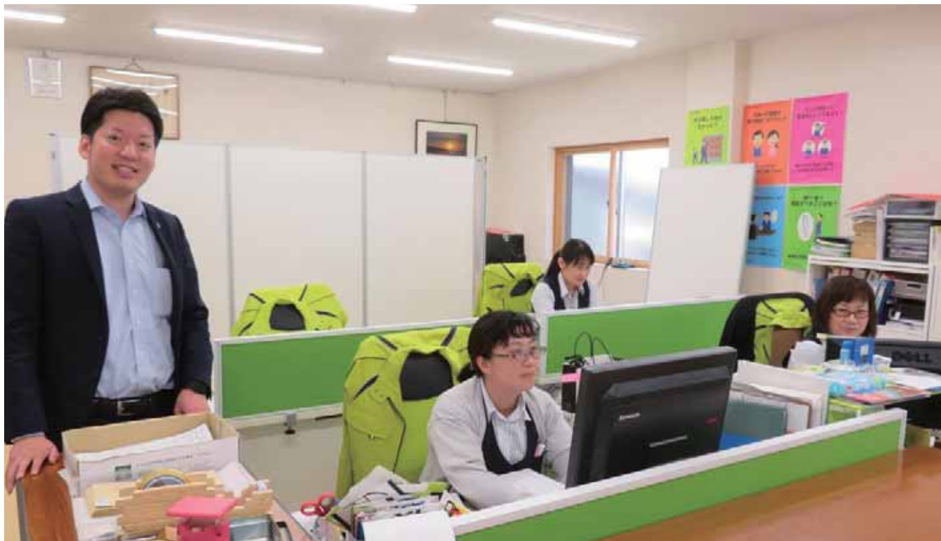
事務所の女子社員と共に

に継続的な安全教育を行っています。この取り組み等が認められ、安全性評価認定制度の最高ランク3つ星の認定を受けています。お客さまに安全・安心・快適な旅を提供して地域No.1の観光バス会社を目指して日々努力しています。