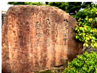
善の巡環を刻んだ石碑

現在の主な事業は、不動産、建設、コンサルティングの3つで、野々市市を中心に地域密着の経営を行っています。入居物件は約