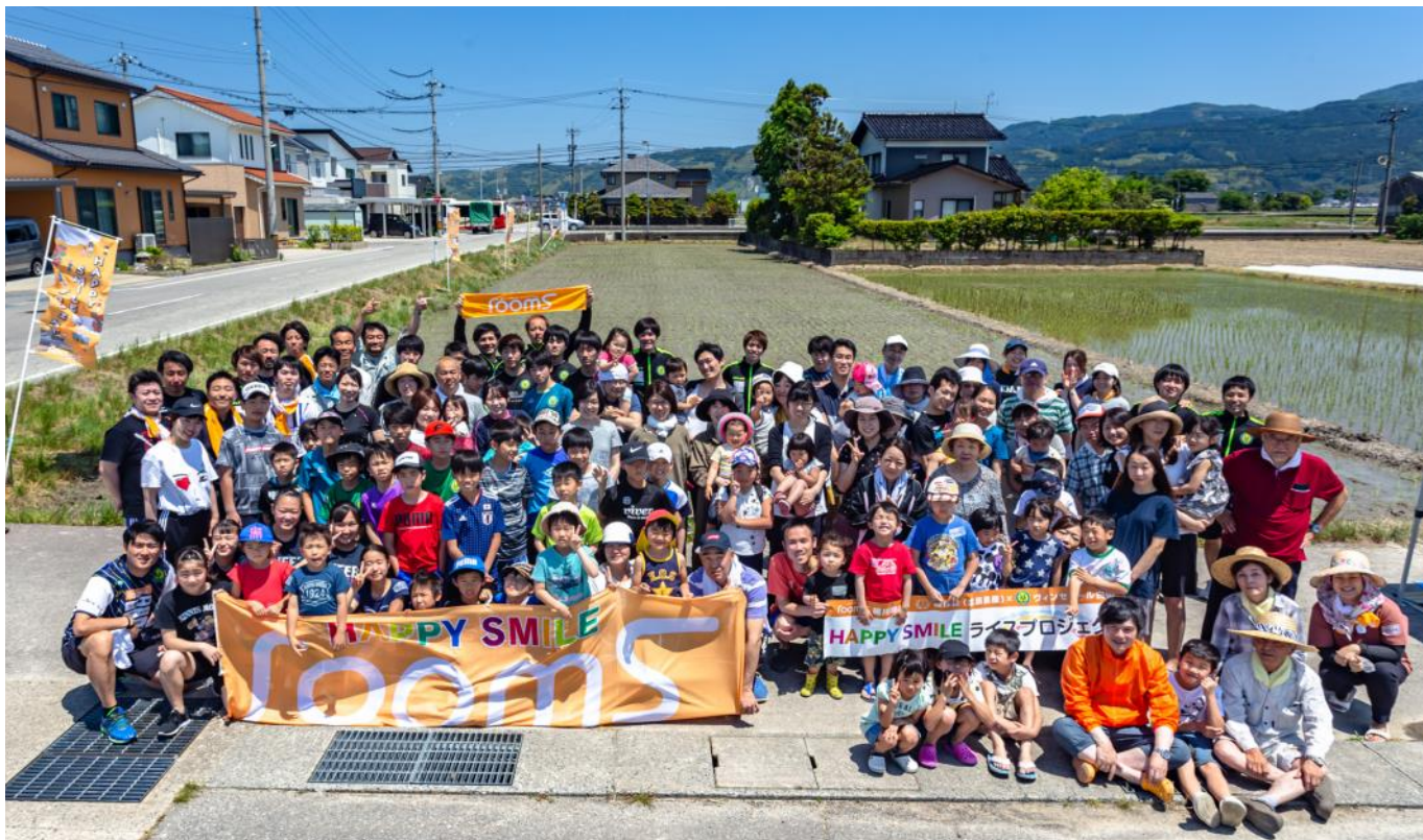
地域貢献活動「北辰農産、ヴィンセドール白山との協働事業で行っている米づくり」

不動産に付随するニーズ一つひとつに応える。そんな顧客目線で事業展開をしてきたことが伝わりました。