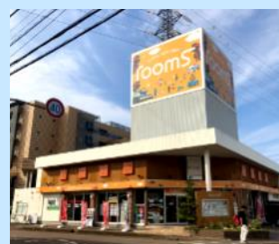
金沢工大前支店：野々市市高橋町24-3

設立/昭和45年12月 従業員数/37名(役員除く) 事業内容/不動産売買事業、賃貸仲介管理事業、不動産コンサルティング事業、新築戸建事業、賃貸住宅事業、リフォーム・リノベーション事業