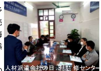
人材派遣会社の日本語研修センター