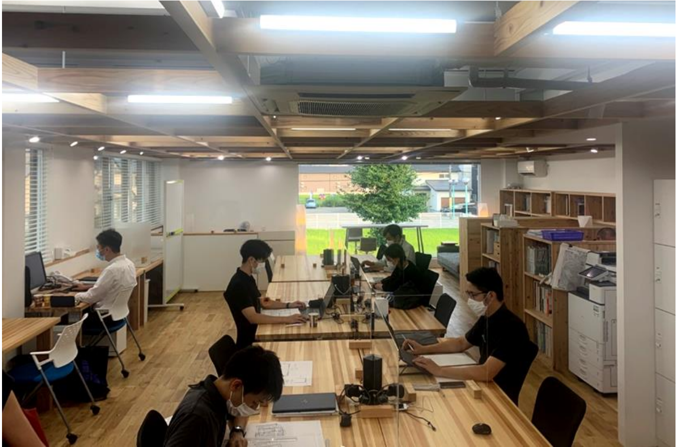
フリーアドレスオフィスになり、他部署同士のコミュニケーションの機会が増えた

果として「営業、設計、施工、総務」など、各部門の情報の共有が容易になり、仕事の効率化を図ることができました。またデータの共有は、どの社員にも公平な情報が得られ、知識や技術を伝えることができます。