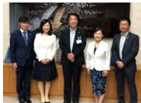
6月18日(金)能美市訪問