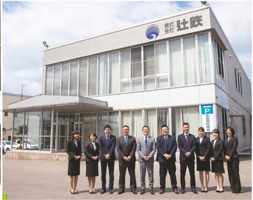
1 金沢市湊にある社屋と従業員の面々。2 同社では現場での施工、監督を担う。同社独自の職人集団「明匠会」を擁するため、商材を取めるだけでなく工事まで一貫して行うことができる。3 社内でのミーティング風景。先輩社員からの手厚いフォローがあるため、安心して業務、技能を習得していくことができる。4 同社倉庫の一部。徹底した品質管理の下、様々なメーカーや商品の中から最適なものを提案する。