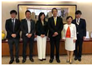
6月25日(金)加賀市訪問