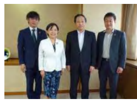
7月2日(金)金沢信用金庫訪問