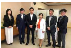
6月25日(金)小松市訪問