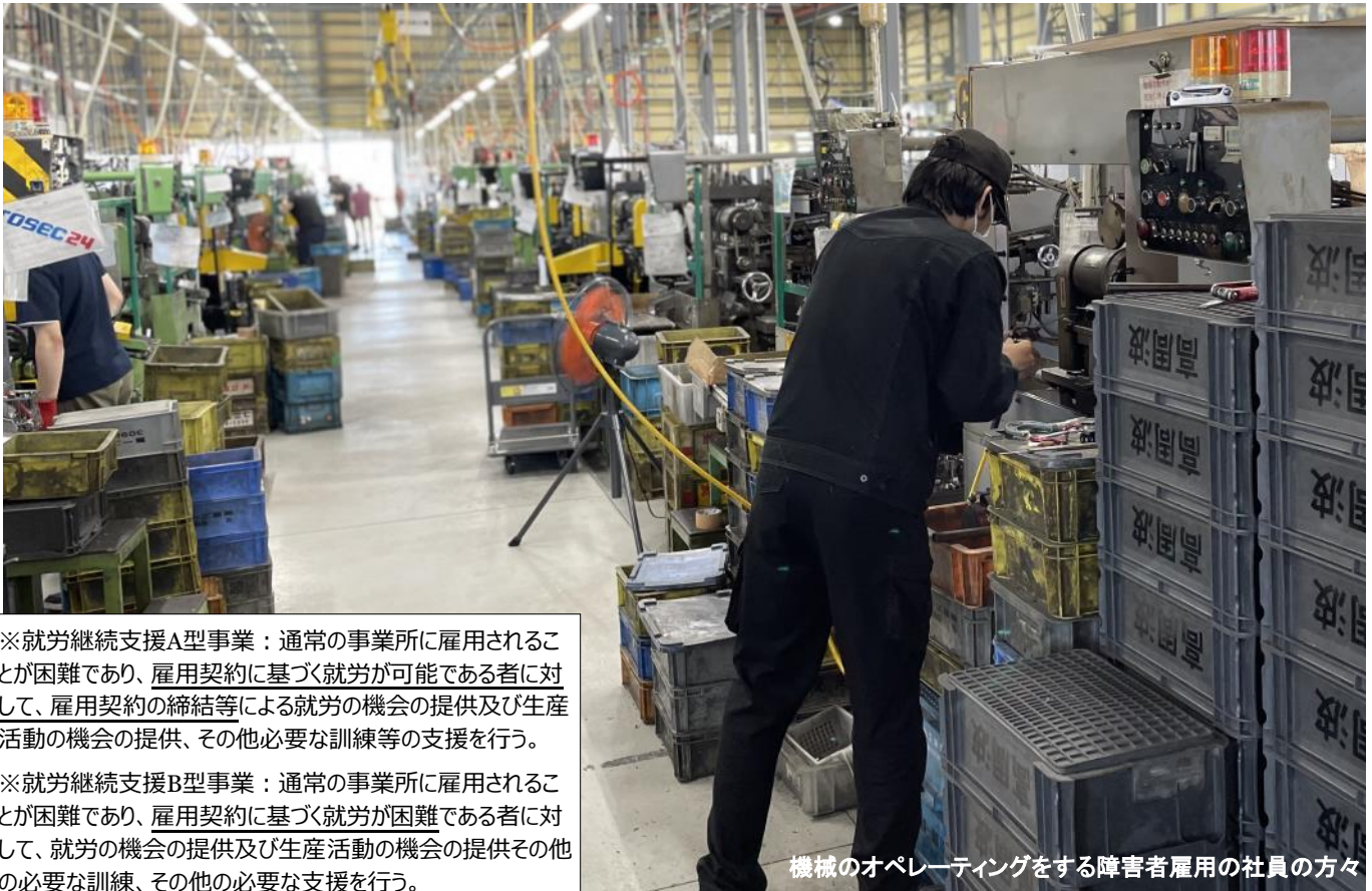
機械のオペレーティングをする障害者雇用の社員の方々

※就労継続支援A型事業：通常の事業所に雇用されることが困難であり、 雇用契約に基づく就労が可能である者 に対して、 雇用契約の締結等による就労の機会の提供及び生産活動の機会の提供 、その他必要な訓練等の支援を行う。 ※就労継続支援B型事業：通常の事業所に雇用されることが困難であり、 雇用契約に基づく就労が困難である者 に対して、 就労の機会の提供及び生産活動の機会の提供 その他の必要な訓練、その他の必要な支援を行う。