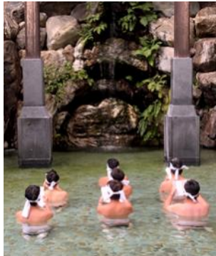
2019年10月31日当時のグループ会「白山比咩神社 みそぎ体験」

今年度の森山グループの活動方針は、「楽しみながら会員相互の理解を深める場とし、支部活動への参加の輪を広げていく」としています。