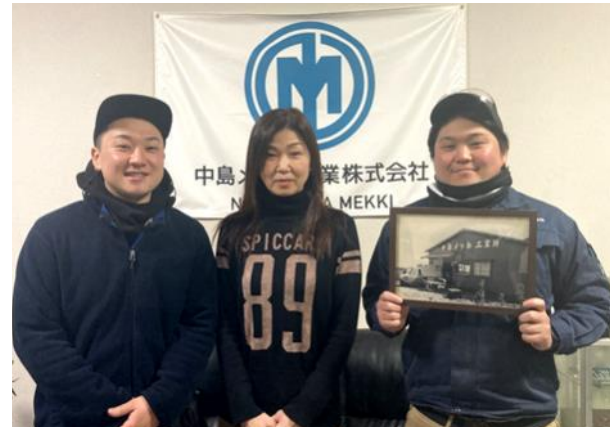
左:中島会員 中:専務(母) 右:弟

経営者がいずれ向き合わなければならない経営課題の一つが「事業承継」です。会員の事業承継の事例を、その想いを含め紹介します。