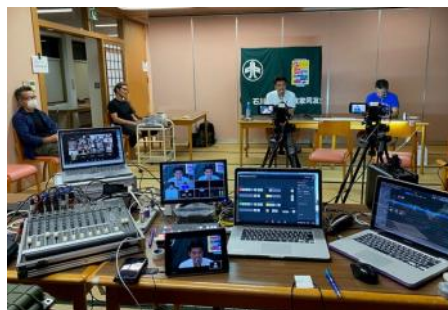
金沢城南支部フェスティバル2021 配信風景