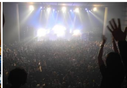
コンサートフェ会場