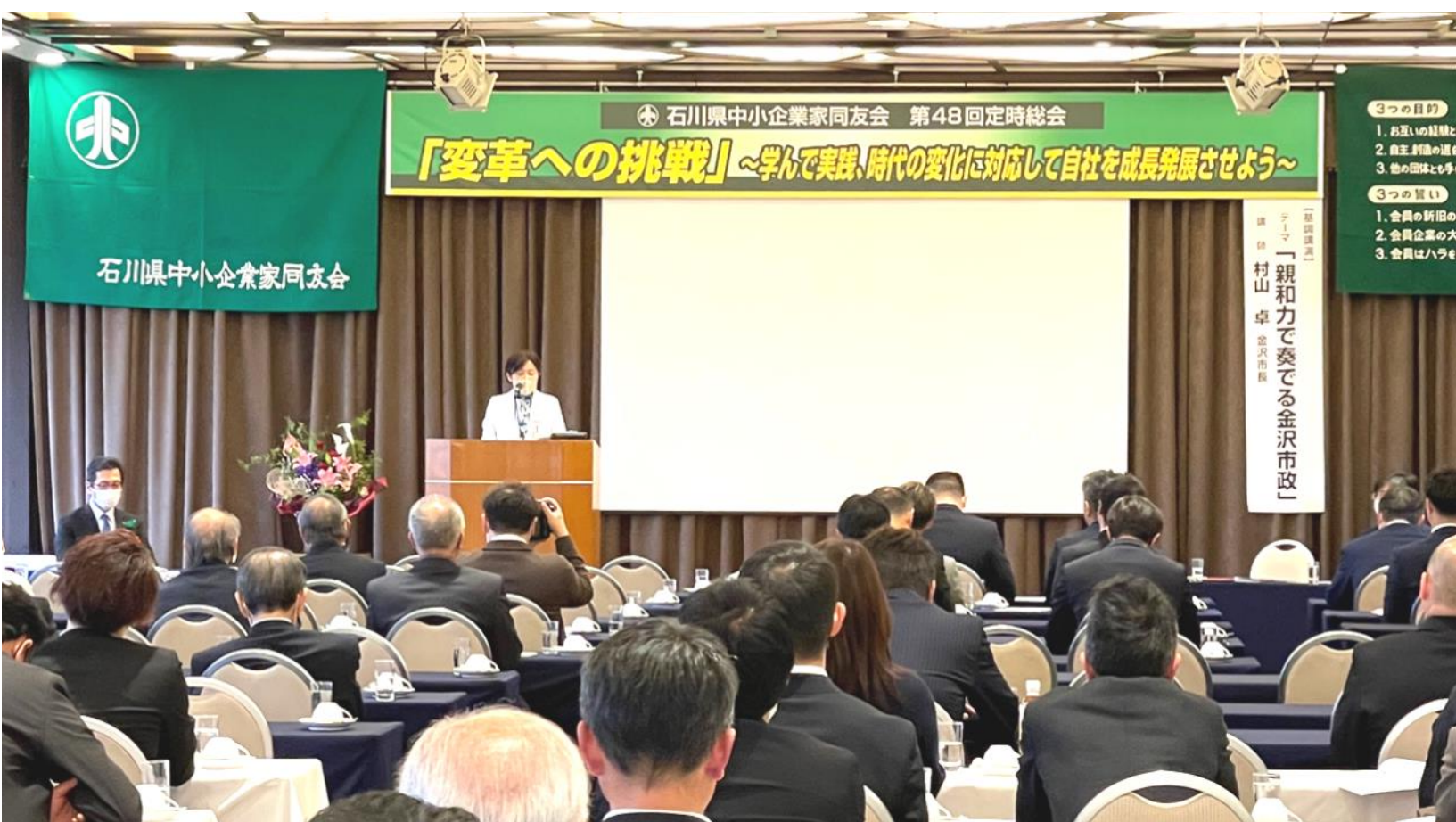
写真：第48回定時総会